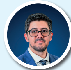
SUNNY LEJEUNE ANCIENS COMBATTANTS