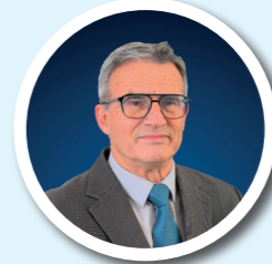
PHILIPPE PROVÉ PROPRETÉ, ENVIRONNEMENT