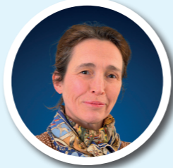
MAYLIS GRIMALDI SANTÉ