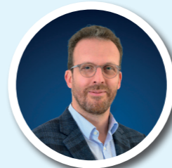
FRANÇOIS DURVY DÉVELOPPEMENT ÉCO