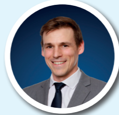
VINCENT OLIVIER ÉDUCATION