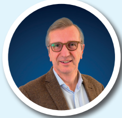
STANISLAS BOUNIOL FINANCES