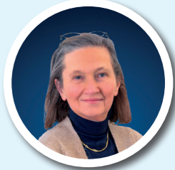
BÉATRIX DE PILOTT ÉVÉNEMENTIEL