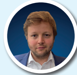
AMBROISE DE RANCOURT PROSPECTIVE