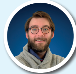
STANISLAS BOTHIER COMMISSION APPEL D'OFFRES