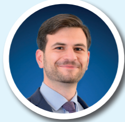
LOUIS-ALDÉRAD MOINARD QUARTIER SAINT LOUIS